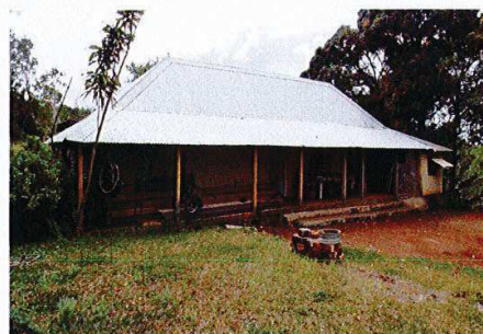
Maison du Chef