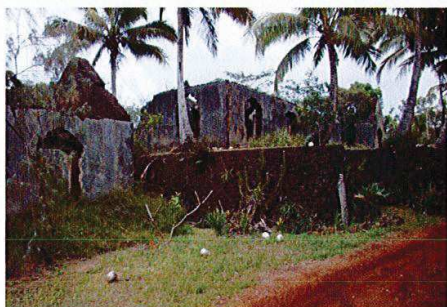
Four – Magasin – Mur de soutènement - Logements